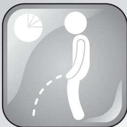
Urinar com frequência