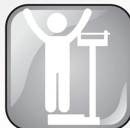
Mantenha o peso ideal