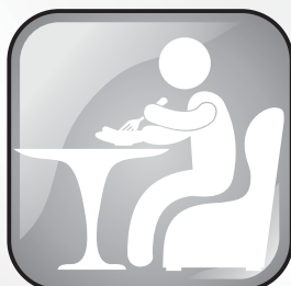
Coma comidas saudáveis