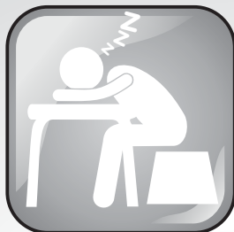
Cansaço e falta de energia