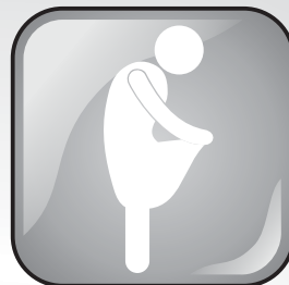
Perda de peso