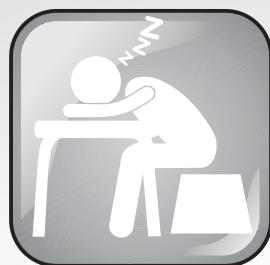
Cansaço e falta de energia