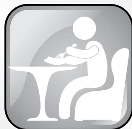
Coma comidas saudáveis