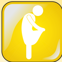
Perda de peso