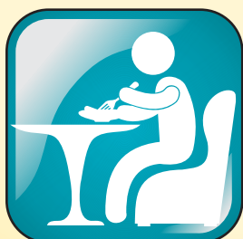
Coma comidas saudáveis