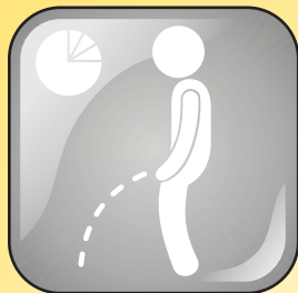
Uninar com frequência