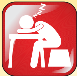
Cansaço e falta de energia