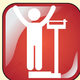
Mantenha o peso ideal