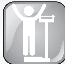
Mantenha o peso ideal